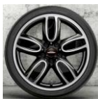
2LY Roda de liga-leve 18" JCW Cup Spoke 2-tons