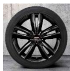
1NH Roda de liga-leve 17" JCW Track Spoke pretas